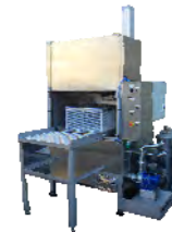
Plateau de lavage extractible