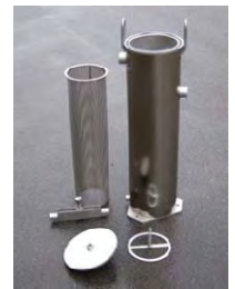
Filtre à poche