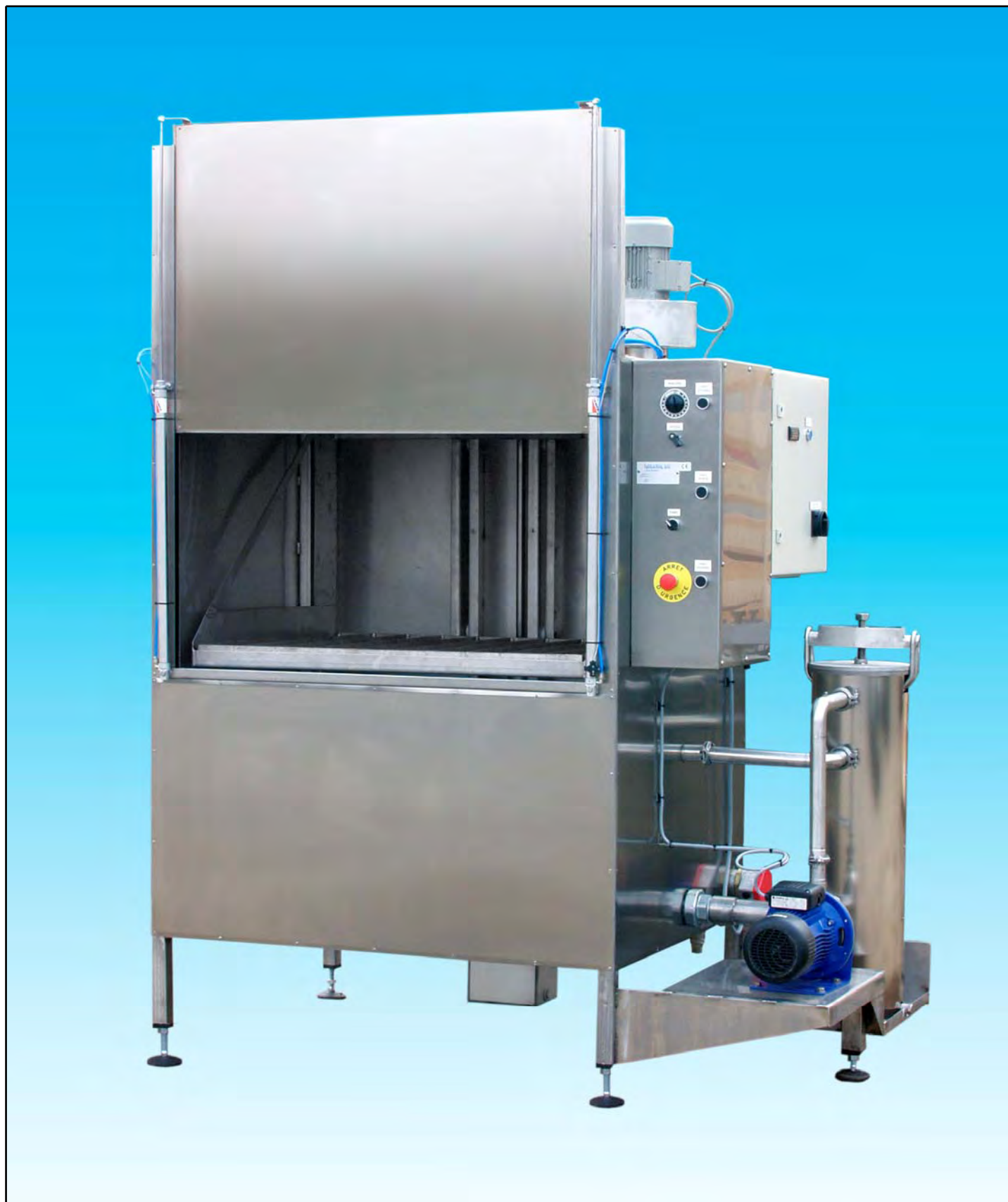
MACHINE A LAYER IMMERSION-AGITATION Avec produits lessiviels